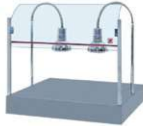
ΗΛΕΚΤΡΙΚΟ ΘΕΡΜΑΝΤΙΚΟ ΜΕ 2 ΛΑΜΠΕΣ ΚΑΙ ΘΕΡΜΑΝΣΗ ΣΤΟ ΚΑΤΩ ΜΕΡΟΣ