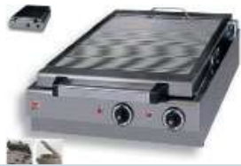
ΣΧΑΡΙΕΡΑ ΗΛΕΚΤΡΙΚΗ ΜΕ ΣΥΡΤΑΡΙ ΝΕΡΟΥ Mod. HS1