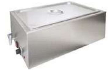
BAIN MARIE GN 1/1X15 εκ. ΜΕ ΒΡΥΣΗ Mod. 200.208