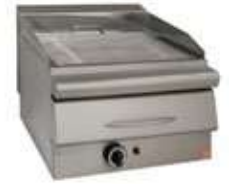
ΣΧΑΡΙΕΡΑ ΑΕΡΙΟΥ ΜΕ ΣΥΡΤΑΡΙ ΝΕΡΟΥ Mod. GS 60