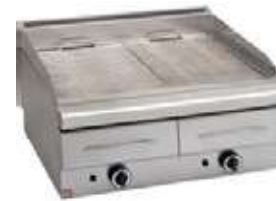
ΣΧΑΡΙΕΡΑ ΑΕΡΙΟΥ ΜΕ ΣΥΡΤΑΡΙ ΝΕΡΟΥ Mod. GS2 2000