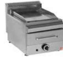
ΠΛΑΚΑ ΑΕΡΙΟΥ ΜΕ ΣΥΡΤΑΡΙ ΝΕΡΟΥ Mod. GP1 2000