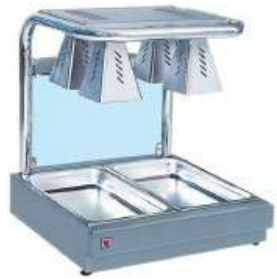
ΘΕΡΜΑΝΤΙΚΟ ΜΕ 4 ΛΑΜΠΕΣ ΘΕΡΜΑΝΣΗΣ Mod. NH 4