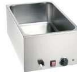
BAIN MARIE GN 1/1X20 εκ. ΜΕ ΒΡΥΣΗ Mod. 200.207