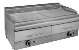
ΣΧΑΡΙΕΡΑ ΑΕΡΙΟΥ ΜΕ ΣΥΡΤΑΡΙ ΝΕΡΟΥ Mod. GS 110