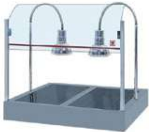
ΗΛΕΚΤΡΙΚΟ ΘΕΡΜΑΝΤΙΚΟ ΜΕ 2 ΛΑΜΠΕΣ ΚΑΙ ΘΕΡΜΑΝΣΗ ΣΤΟ ΚΑΤΩ ΜΕΡΟΣ (ΠΥΡΞ)