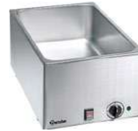
BAIN MARIE GN 1/1X15 εκ. Mod. 035.0215