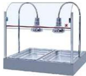
ΗΛΕΚΤΡΙΚΟ ΘΕΡΜΑΝΤΙΚΟ ΜΕ 2 ΛΑΜΠΕΣ ΚΑΙ ΘΕΡΜΑΝΣΗ ΣΤΟ ΚΑΤΩ ΜΕΡΟΣ ΤΗΣ ΛΕΚΑΝΗΣ.