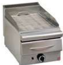
ΣΧΑΡΙΕΡΑ ΑΕΡΙΟΥ ΜΕ ΣΥΡΤΑΡΙ ΝΕΡΟΥ Mod. GS1 2000