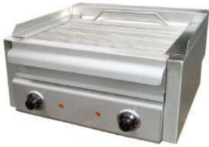
ΣΧΑΡΙΕΡΑ ΗΛΕΚΤΡΙΚΗ ΜΕ ΣΥΡΤΑΡΙ ΝΕΡΟΥ Mod. G3040