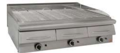
ΣΧΑΡΙΕΡΑ ΑΕΡΙΟΥ ΜΕ ΣΥΡΤΑΡΙ ΝΕΡΟΥ Mod. GS3 2000