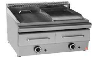
ΠΛΑΚΑ ΑΕΡΙΟΥ, ΜΕ ΣΥΡΤΑΡΙ ΝΕΡΟΥ ΚΑΙ 1 INOX ΣΧΑΡΑ Mod. GPS2 2000