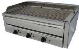
ΣΧΑΡΙΕΡΑ ΗΛΕΚΤΡΙΚΗ ΜΕ ΣΥΡΤΑΡΙ ΝΕΡΟΥ Mod. G3060