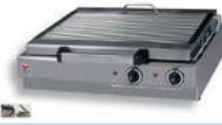
ΣΧΑΡΙΕΡΑ ΗΛΕΚΤΡΙΚΗ ΜΕ ΣΥΡΤΑΡΙ ΝΕΡΟΥ Mod. HS1/2