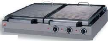
ΣΧΑΡΙΕΡΑ ΗΛΕΚΤΡΙΚΗ ΜΕ ΣΥΡΤΑΡΙ ΝΕΡΟΥ Mod. HS2